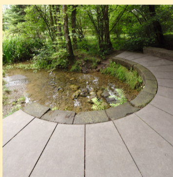
Die Quelle der Strunde

Hier an der Quelle der Strunde kann man sich gut vorstellen, wie Max Bruch seine Bergischen Stücke komponiert hat.