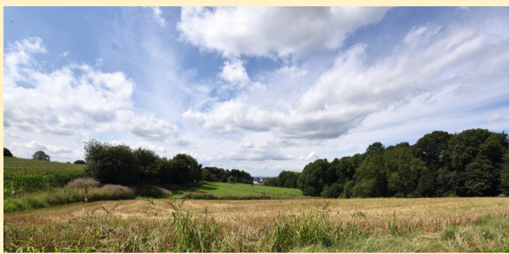
Blick ins Rheintal von Rommerscheid aus

Man begeht nun das freie Feld, die obere Rheinterrasse und findet nach etwa 500 Metern den Rheintalblick, einen ruhigen Rastplatz. Zwischen Bäumen fällt der Blick in das Rheintal und auf die fernen Höhenzüge der Voreifel.