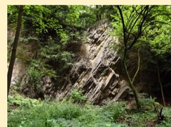
Steinbruch in den Gärten der Bestattung

Wir folgen dem asphaltierten Weg, der nach wenigen hundert Metern in einen Feldweg übergeht und uns in den Wald führt. Zwischen mächtigen Buchen führt der Weg nun über die Höhe und biegt bald links ab zur Halfen Dombach und weiter bis zur Dombach-Sander-Straße. Wir wenden uns nach rechts und folgen der Straße etwa 200 Meter, bis zu den "Gärten der Bestattung". Hier können wir einen Abstecher zum Naturdenkmal Steinbruch machen.