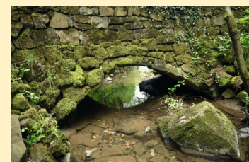
Das steinerne Brückchen

Der Rückweg führt über die Straße Herrenstrunden vorbei am Alten Freibad bis zum Gut Schiff. Dort biegen wir nach links in den Hombacher Weg und folgen dem Verlauf der Straße, bis nach etwa 300 Metern der Weg über ein steinernes Brückchen in den Wald abzweigt. Stetig geht es nun etwa 500 Meter leicht bergan, bis wir wieder auf einen Feldweg treffen. Dort biegen wir nach rechts und stehen bald vor einem Wegekreuz.