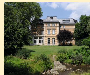
Kunstmuseum Villa Zanders