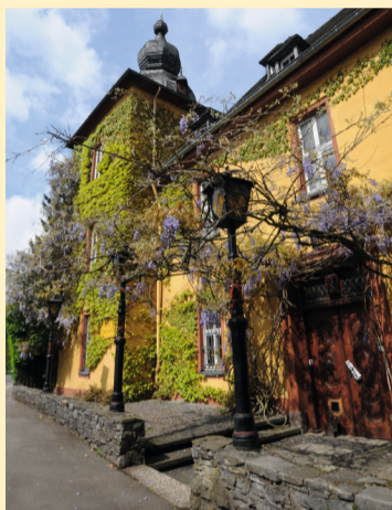
Die Burg Zweiffel

Der Weg verläuft nun zwischen Weiden und Feldern. Hinter hohen Buchen liegt etwas abseits der Igeler Hof, wo sich Max Bruch seinerzeit aufgehalten und gearbeitet hat. Durch einen Hohlweg geht es nun bergab bis zum Burgteich an der Burg Zweiffel in Herrenstrunden.