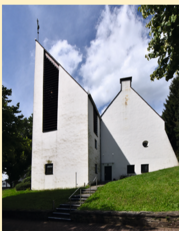
St. Engelbert in Rommerscheid

Über diesen Fußweg, der sich etwa 1 bis 2 Kilometer durch das bewaldete Naturschutzgebiet schlängelt, gelangt man nach Rommerscheid und zum Rommerscheider Dorfplatz.