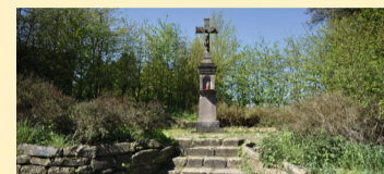
Das Hombacher Wegekreuz

Max Bruch war protestantischer Christ. Die Inschrift auf seinem Grabstein in Berlin spricht für sein Werkverständnis: „Musik ist die Sprache Gottes“.